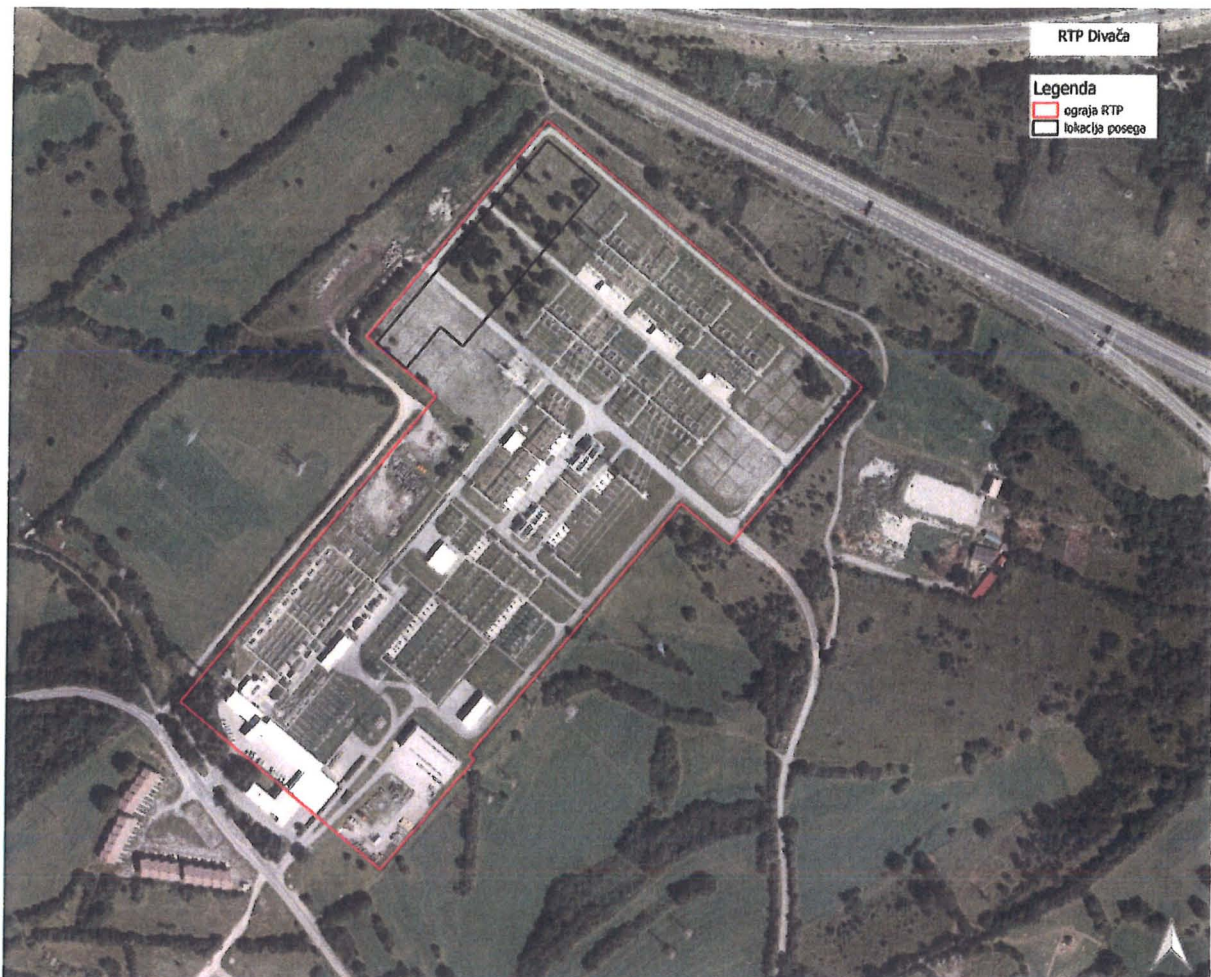
Shema lokacije posega znotraj RTP Divača

Ocenjujemo, da se bo poseg izvajal na površini cca. cca. 0,81 ha znotraj ograje RTP, ki obsega 10,50 ha.